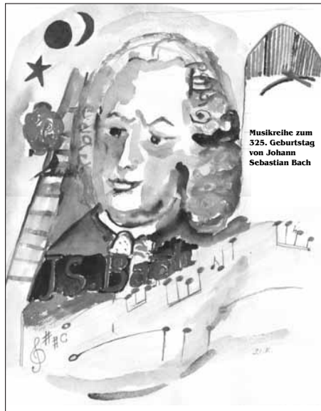
Musikreihe zum 325. Geburtstag von Johann Sebastian Bach

Im Jahr 2010 jährt sich Bachs Geburtstag zum 325. Male. Für uns ist das ein Anlass, die Kirchenmusik Bachs, der ja auch gerne als der „fünfte Evangelist“ bezeichnet wird, aufzuführen. Durch das Kirchenjahr ziehen sich zwei „virtuelle“ Zyklen: drei Veranstaltungen mit Kantaten und Oratorien sowie