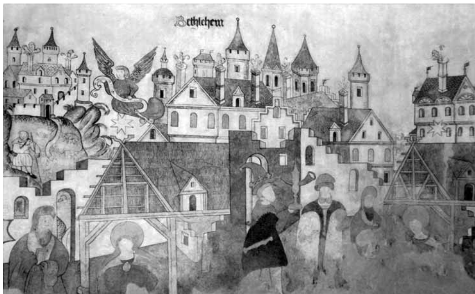
Wandmalerei, Ev. Kirche Rückerhausen, 1559