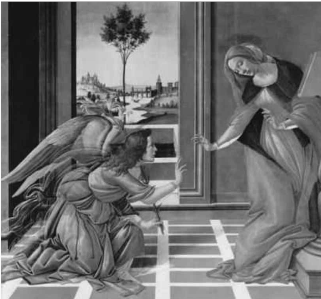
Sandro Botticelli, Verkündigung Mariae

Alte Nikolaikirche Römerberg Frankfurt am Main