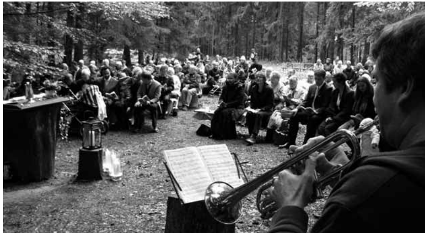
Waldgottesdienst am 6. September auf dem Glaskopf im Taunus mit der Andreaskirche