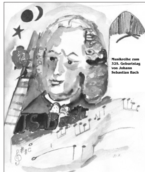
Musikreihe zum 325. Geburtstag von Johann Sebastian Bach

Nach Rückfragen über häufiges Klatschen, insbesondere nach der Schlussmusik, möchte ich gerne ein paar Denkanstöße geben. Die evangelische Kirche im Rheinland hat kürzlich einen Kirchenknigge herausgebracht, in dem es hierzu sinngemäß heißt: „Selbst Klatschen in der Kirche ist erlaubt. Das Gebot des Satirikers Robert Gernhardt: ‚Paulus schrieb an die Apatschen: Ihr sollt nicht nach der Predigt klatschen‘, ist ohne jede Bedeutung. Schließlich ist Beifall zumindest in der jüdischen Religion ein altes liturgisches Element. Und nach einer guten Predigt dürfen Gläubige durchaus ihre Zustimmung bekunden. Das Klatschen ist „der körperliche Ausdruck des Amen“. Dem kann ich mich im Wesentlichen anschließen. Es muss nur immer klar sein, wem dieses Klatschen gilt: eben nicht uns, sondern Gott allein. Um dies an der Musik auszuführen, möchte ich ein wenig ausholen: Es gibt Musikstücke, in denen der Komponist es